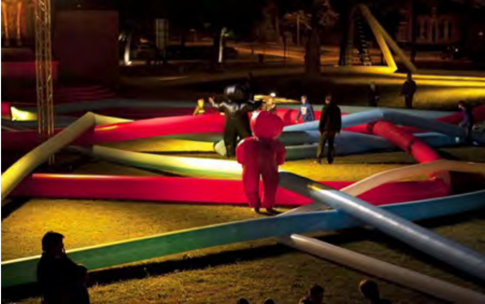
Fornøyelsespark: Tunnel of Thoughts / The Pillars of Creation . Disse store luftfylte rørene danner et stort tunnelnettverk.

«Folk har i de siste årene fortalt meg at fantasien jeg viser i mitt arbeid også appellerer til barn. Vanligvis viser jeg en serie bilder som snakker for seg selv. Kan også barn like det?»